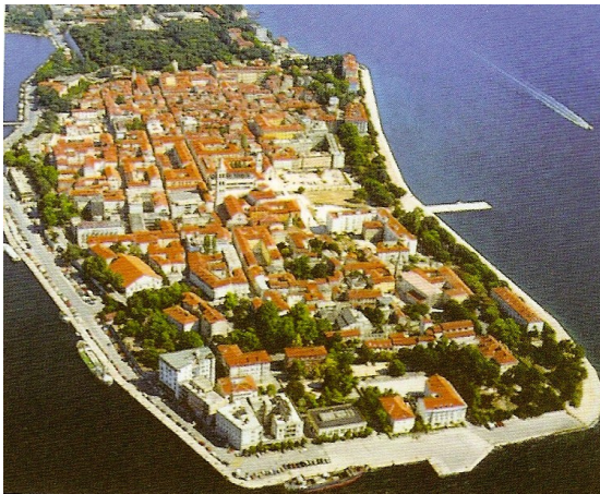
1. ábra: A dalmáciai Zára városa

Frigyes serege öt egységből állt, melynek második egységét a magyarok és csehek alkották. Mikor úgy tűnt, hogy a bizánci császár és Frigyes között háború kezd kitörni Béla visszahívta a magyarokat. Béla a két császárra nyomást gyakorolva (a bizánci császárra és Frigyes német-római császárra) elérte, hogy 1190 februárjában megkössék a drinápolyi békét. A közvetítés és a béke magyar érdek